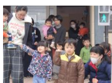
うさぎルーム 交通教室