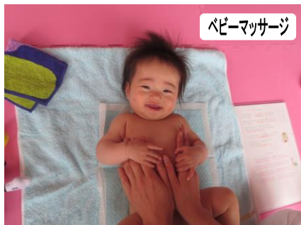
ベビーマッサージ