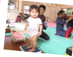
一人で体重を測れたよ