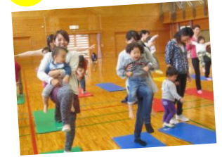
お友達もお母さんも笑顔いっぱい