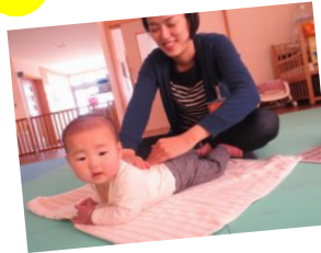
赤ちゃんもお母さんもリラックス