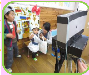
下田幼稚園園庭開放・交流

吐く息の白さや風の冷たさに冬を感じるようになってきましたね。体調を崩す、熱、咳、鼻水などの症状がみられるお子さんの話を耳にすることが増えています。発育測定の際の保健師さんのお話では、感染症予防の基本は手洗いからということです。冷たい水にササッと済ませていませんか。感染症予防には正しい手洗いを行うことが大切だそうです。食事やおやつの前、外から帰宅した時、調理の前、おむつ交換後など丁寧に洗って、感染症から身を守りましょう。※手洗いの方法は『ビオレ』や『サラヤ』のホームページを参考にしてみてください。