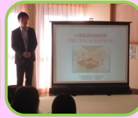
静岡県子育て支援推進事業① 大塚製薬